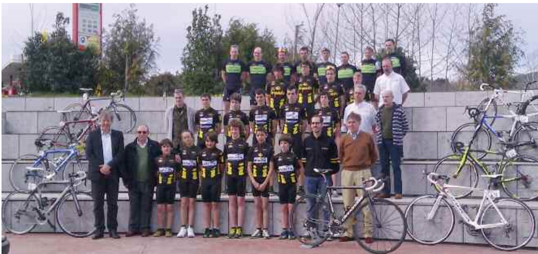
Irungo Txirrindulari Elkarte taldeen 2013ko denboraldirako argazkia.