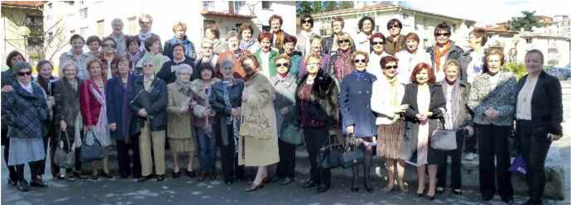
Bazkide taldea, Emakumearen Astea dela-eta aurten egin duten ekitaldi batean.