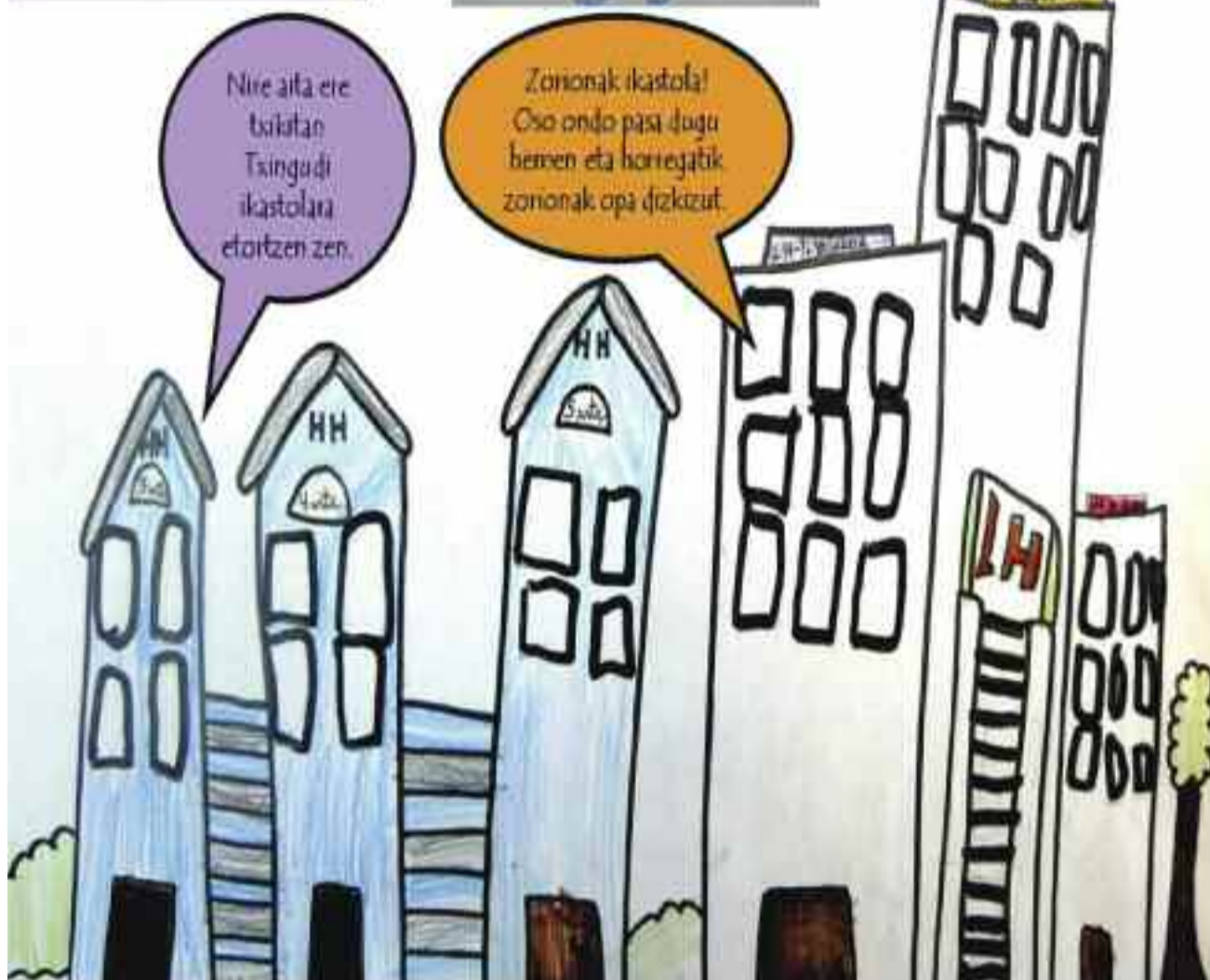
Goiko marrazkiaren egilea: Oier Rios (2. A). Eskuinekoa 5. Fko ikasleen lana da.