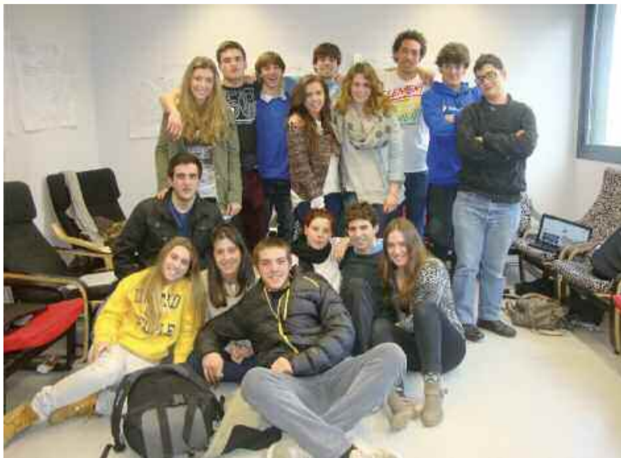
Lidergo Ekintzaile graduiko ikasle talde bat.