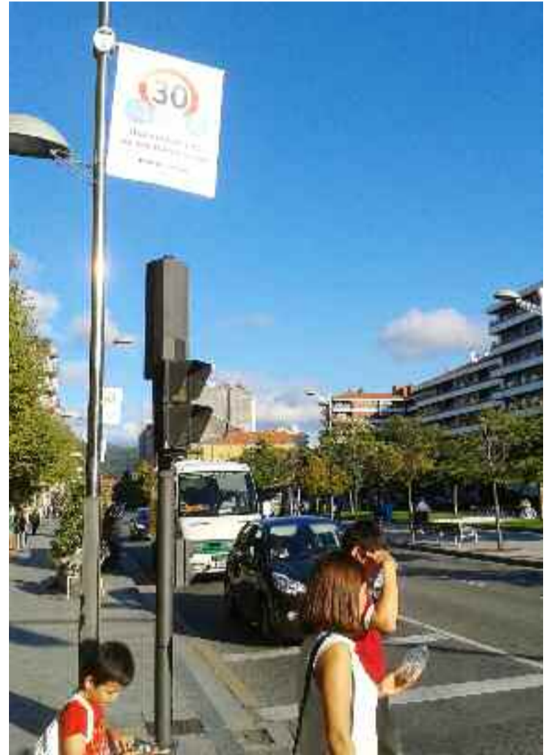
Kolon ibilbidean abiadura-muga orduko 30 km-koa da 2011z geroztik.

Bestalde, Berrotaran, Legia eta Joaquin Gamon kaleetan orduko 20 km-ko abiadura-muga indarrean jarriko da.