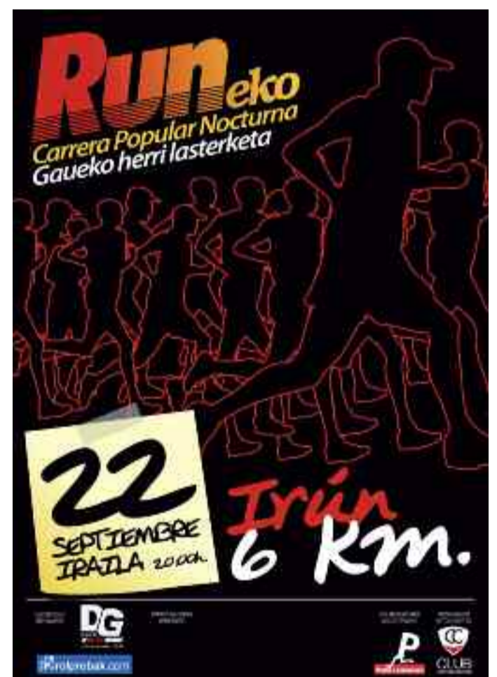
Iazko edizioaren kartela.