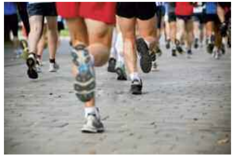
Ezkerrean, iazko lasterketa San Juan Harria plazan.