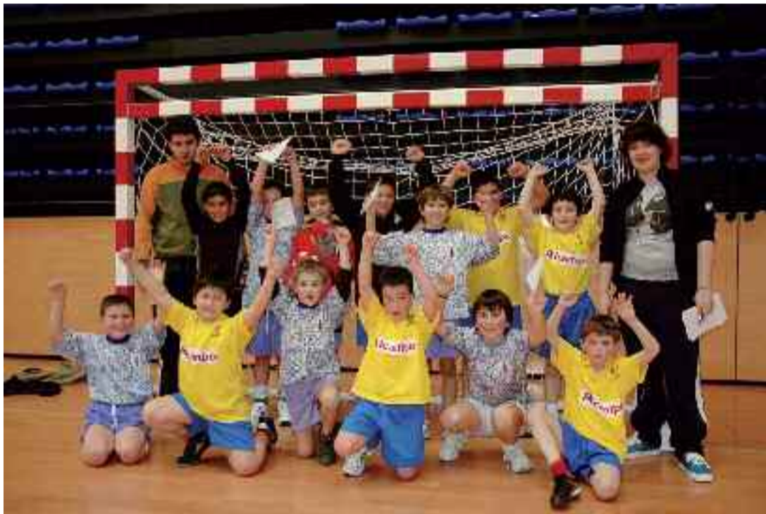
Goian eta eskuinean, eskubaloia. Behean, neskek softbolean.