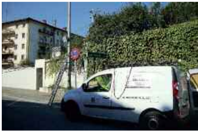
Ezkerrean, farolan ikus daitekeen tresnak ibilgailuen abiaduraren inguruko datuak jasotzen ditu.

Joan den uztailetik hirigunean orduko 30 km-ko abiadura gainditzea debekatuta dagoela adierazten duten seinaleak jarri dituzte Irunen. Informazio kanpainaren bigarren fasea hasiko da laster. Oro har, ibilgailuak lehen baino motelago dabiltzala uste du Udaltzaingoak.