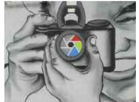
Ezkerrean, bazkide talde bat. Goian, egoitzako kanpo aldeko graffiti-tia. Behean, elkarteak antolatutako txango bat.