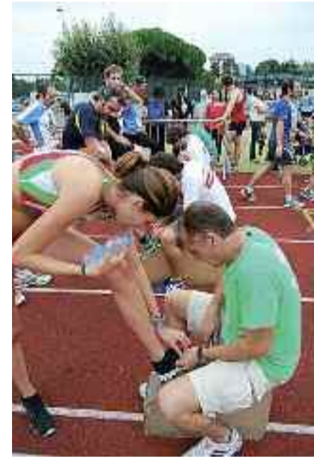
Iazko Txingudi Korrikaren zenbait argazki.