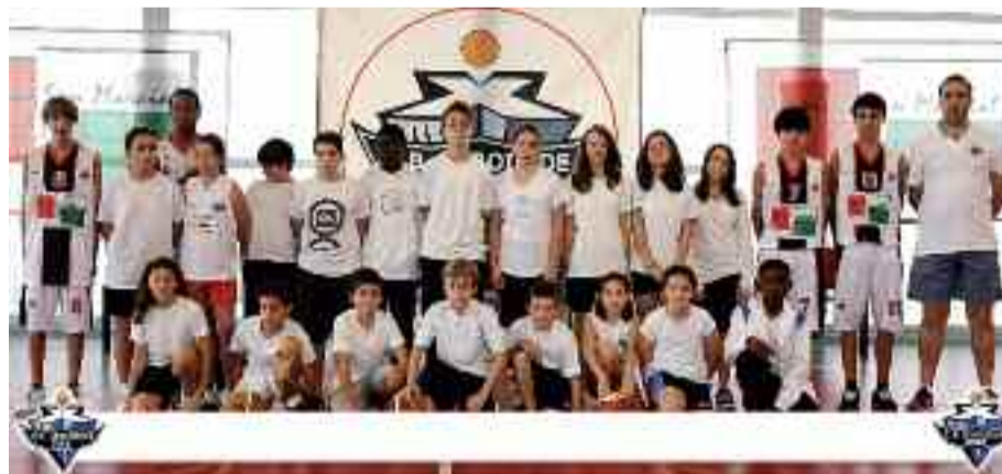
2012-2013 denboraldiko eskola.