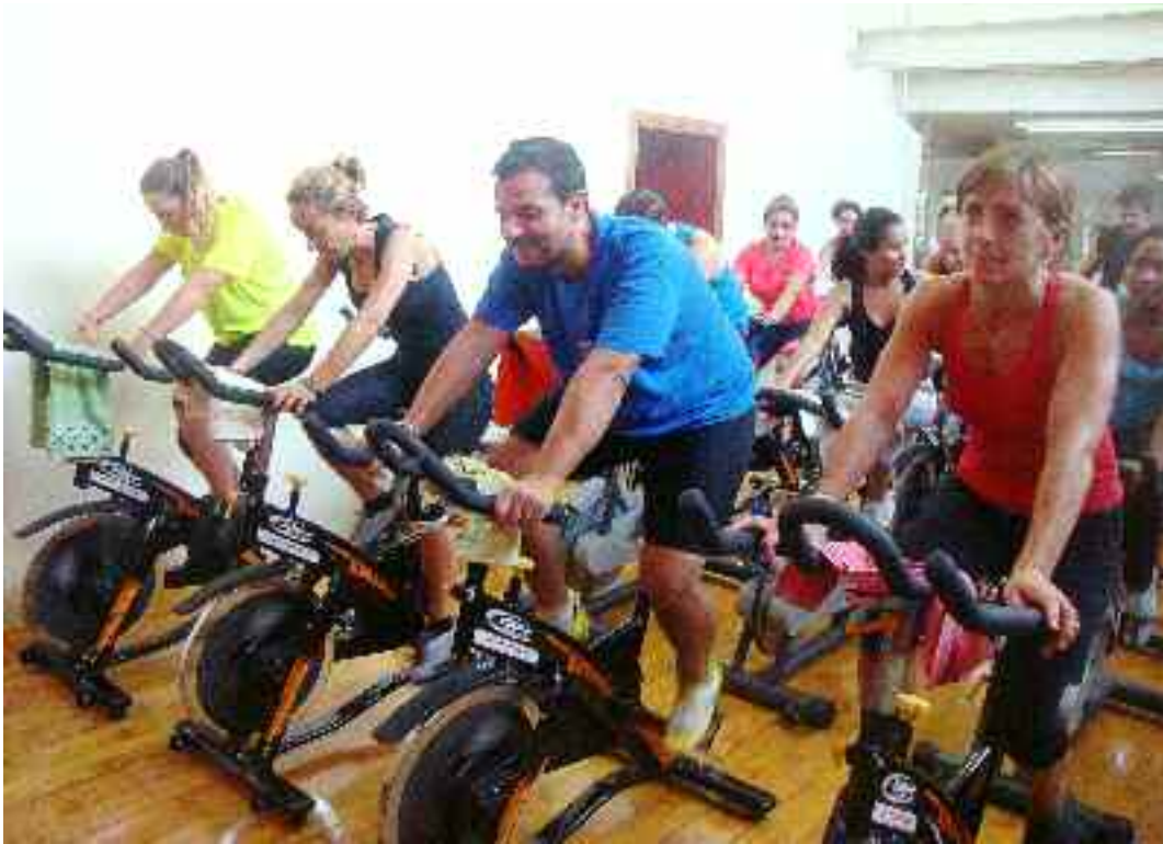
Goian, Cycling saio bat. Eskuinean, Zumba. Behean, Shirai maisua Kirolako arte martzialetako talde batekin.