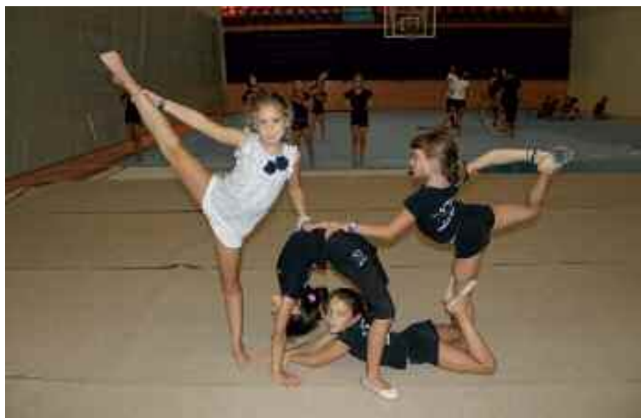
Ayamendi Klubeko lau gimnasta, ariketa bat egiten.