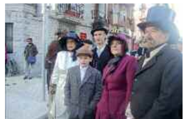
Herritar burges talde bat.