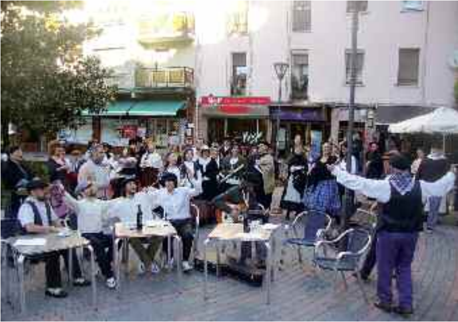
Ezkerrean, tabernako eszena. Eskuinean, garaiko Irungo goi mailako pertsonaiak.