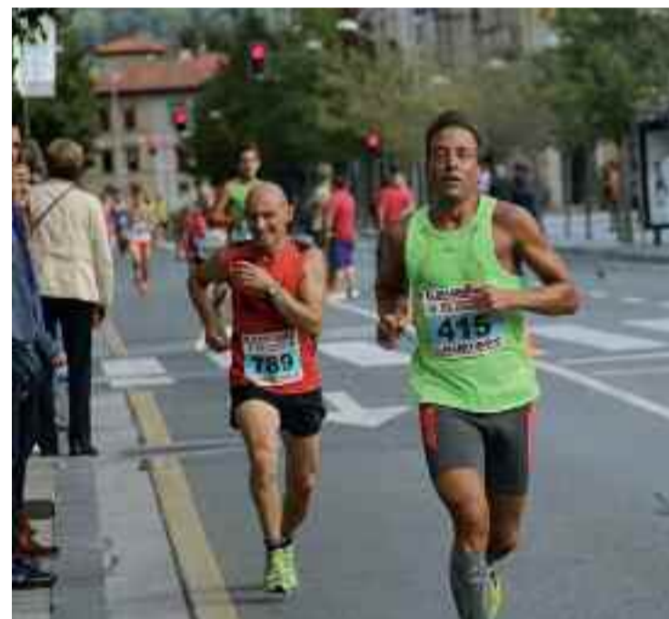
Aurtengo Txingudi Korrikako irudi bat.