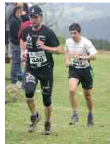
Bi mugalari aurtengo Erlaitz - Aiako Harria Maratoi Erdian.

sartu ziren taldean. "Ekimen ugari antolatzen dituzte. Garrantzitsuena Erlaitz - Aiako Harria Erdi Maratoia da. Sare sozialen bitartez geratu eta 50-70 bat lagun elkartu ohi dira. Oso giro ona dute. Korrika egiten dute,