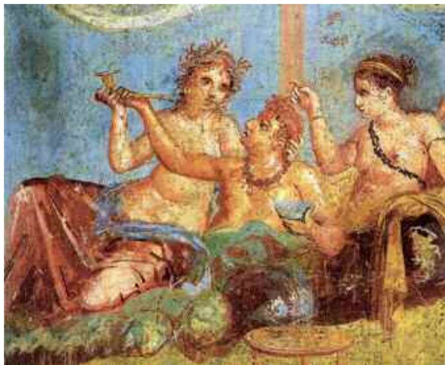
Erromatarrekin batera etorri zen lehen iraultza garrantzitsua euskal sukaldaritzan.

Baina gizakia garatzen joan zen heinean, elikagaiak eta hauek prestatzeko teknika berriak ezagutzen joan zen; adibidez: gizakiaren biziraupen behararen ondorioz historiaurrean garatu ziren Euskal Herrian ehiza, arrantza, abeltzaintza eta nekazaritza.