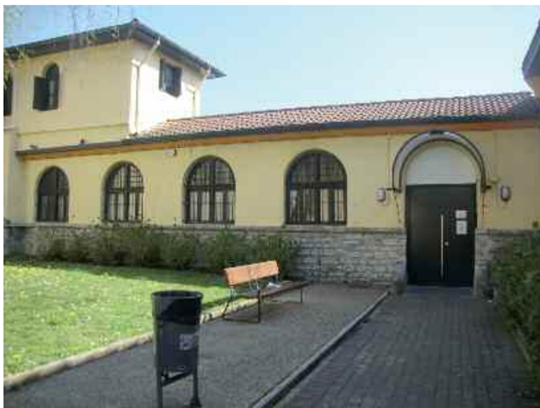
Topagunea eta jangela soziala Ospitale Zaharrean daude.