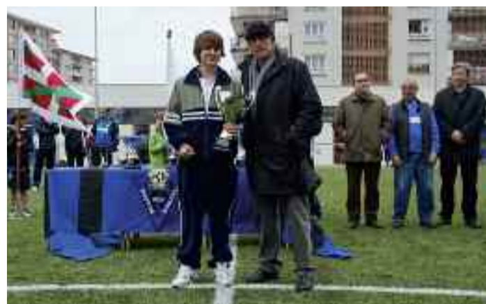
Goian, aurtengo edizioan parte hartuko duten Dunboa-Eguzkiko jokalaria. Behean, Dunboa-Eguzkiko jokalaria, XXXI. edizioko saria jasotzen.

Dunboa-Eguzki Kirol Klubak urtero antolatzen duen lehiaketaren XXXII. edizioa izango da aurtengoa. , Apirilaren 19tik 21era, Estatuko futbolari gazte hoberenen jokoa gertutik ikusteko aukera izango dute Larreaundiko futbol zelaira hurbiltzen diren zaleek.