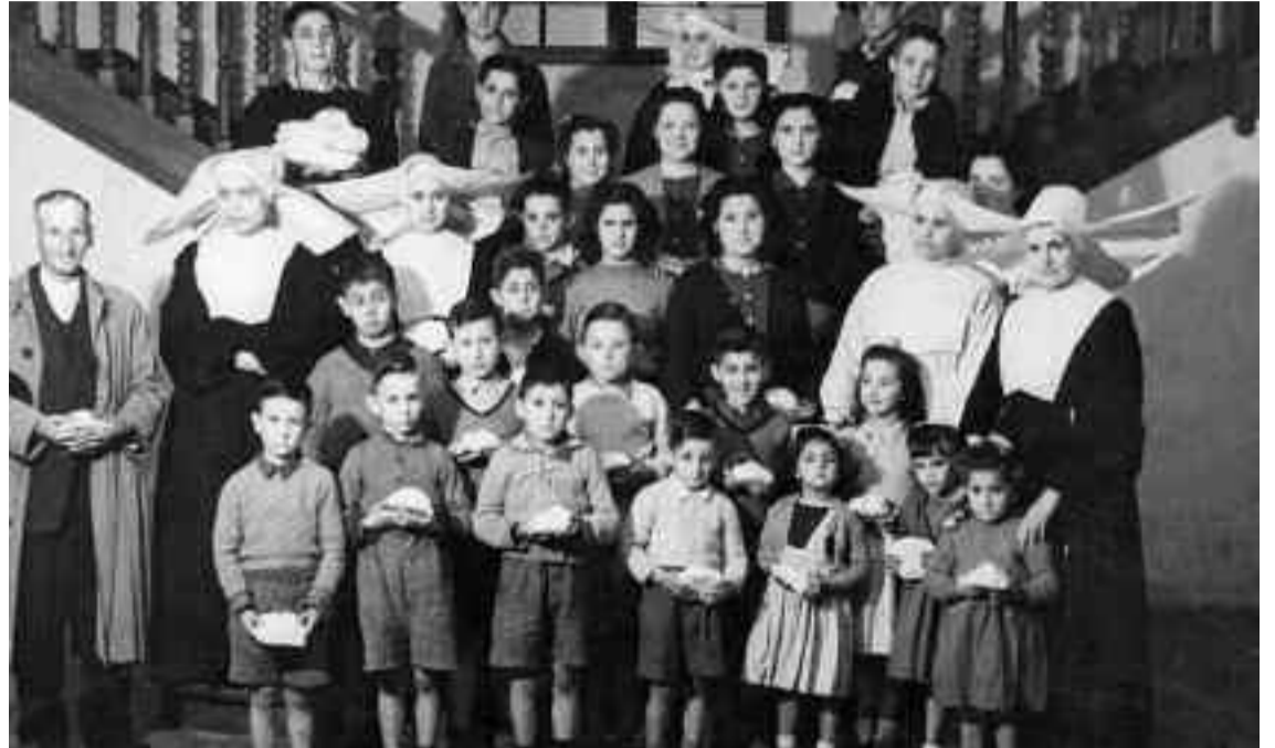
Irun udal artxiboa: 27453

Haurrek sekulako ilusioz espero dute San Markos eguna opila jasotzeko. Amabixientzako ere egun pozgarria da, bereziki beren haur besoetakoei opari gozoa emateko unea. Eta gainontzeko-entzat, zer nolako xarma du apirilaren 25ak? Txikitako oroitzapenak gogoratzeko eta, jakina, bizkotxoa dastatzeko parada. Halaxe, aurten ere tradizioari eutsiko diote bidasoarrek. Hona jatorriari buruzko azalpen xumea.