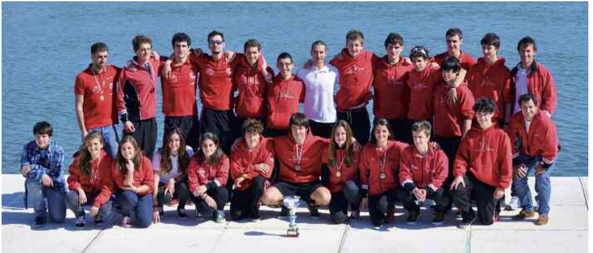
Santiagoarrak K. Eko kideak Euskadiko Maratoi Txapeldun izendatu ondoren.