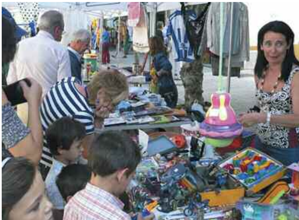
Azokan partikularrek zein elkateek bigarren eskuko gaiak sal ditzakete.

Edozein informazio behar izatera, dei telefono honetara, 902 119 383 .