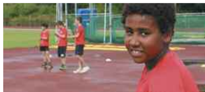
BATEko neska- mutilak jolasak egiten Plaiaundiko pistan.