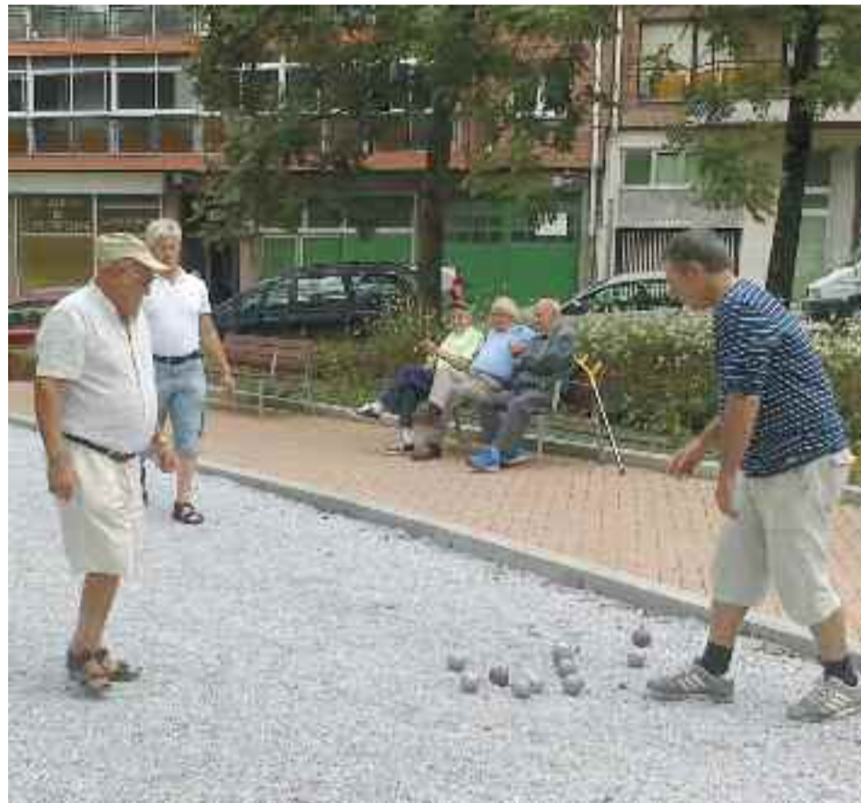
Argazkietan San Migel auzoan petankan aritzen diren jokalaririk ikus ditzakegu.

Ohikoa izaten da herrietan jubilatutako taldeak petankan jolasten ikustea. Bidasoaren beste aldean tradizio handia du bola-jokoak, baina Irunen ere badira petankan arituak eta adituak. San Migel auzoko futbol zelaiaren aspaldi hasi ziren elkartzeko. Gaur egun, bertan dagoen parkean pista dotorea daukate.