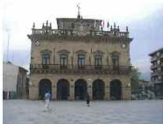
Irungo udaletxea San Juan enparantzan dago