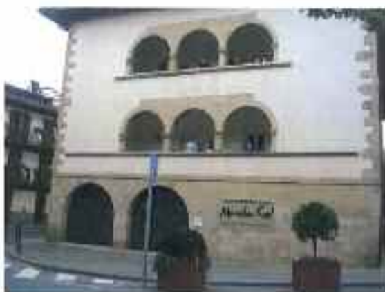
Menchu Gal muscoa Vega de Eguzkitza kalean dago