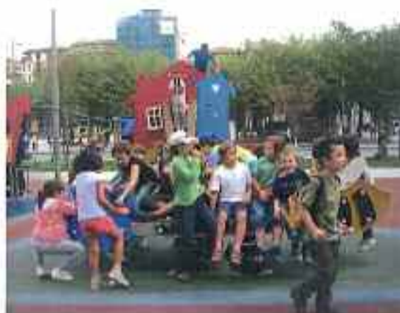
Luis Mariano kalean parke ederra dago