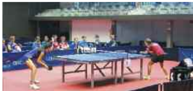
Emakumeen ETTU Cup lehiaketa