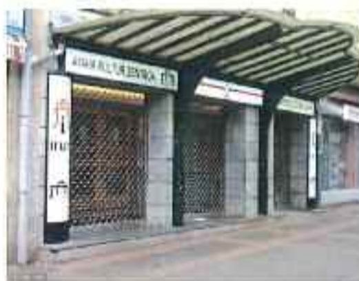
Amaia Kultur Zentroa Pio XII enparantzan dago