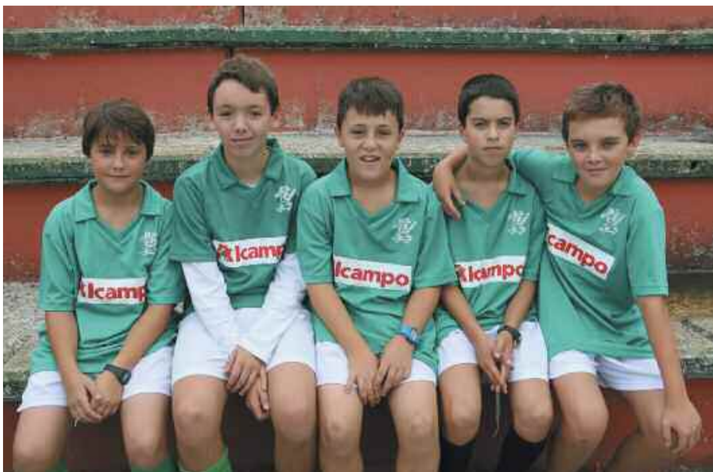
Eskola Kirola programan parte hartzen duten zenbait haur.

Kirolarekin lotura estua duen hiria da Irun. Asko dira goi mailan izan diren eta ari diren elkarte eta kirolariak. Hainbat kirol eta modalitatetan lortu dute oihartzuna irundarrek. Baina, horretarako, txikitatik kirol jarduera sustatzea ezinbestekoa izaten da. Udalak martxan jarritako Eskola Kirola eta Ikas Sasoi programek formazio-lan horixe dute helburu.