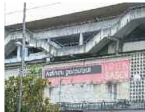
Azken Portu eta Artaleku polikiroldegiak

gazte edo heldu, denek daukate hainbat kirol jardueratan aritzeko aukera. Igerilekuari dagokionez, arrakastatsuenak hasiberrientzako ikastaroak izaten dira. Aretoetan, berriz, pilatesa eta cycling delakoa dira izarrak.