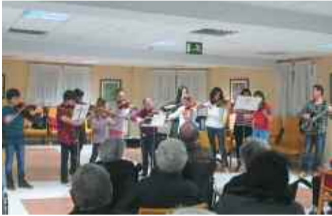
Udal Kontserbatorioko ikasleek kontzertu bat eskaini zieten Caserreko egoiliarreei.