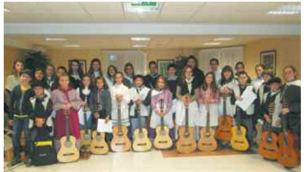
Hamabost gaztek baino gehiagok gitarra kontzertu bat eman zuten.