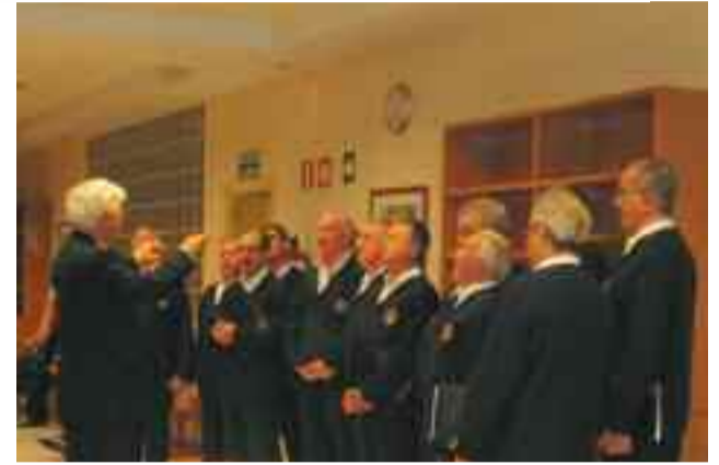
Gaztelubide abesbatzak kantu sorta bat abestu zuen entzuleen gozamenerako.