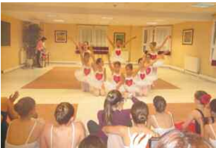
Kontserbatorioko balleteko ikasleek emanaldi bat eskaini zuten.