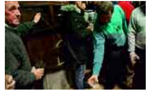
Musika, bertsoak eta giro paregabea egon ohi da Ola Sagardotegian.