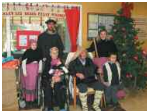
Olentzerori harrera eta Jaiotza Biziduna izan ziren egindako beste bi jarduera.