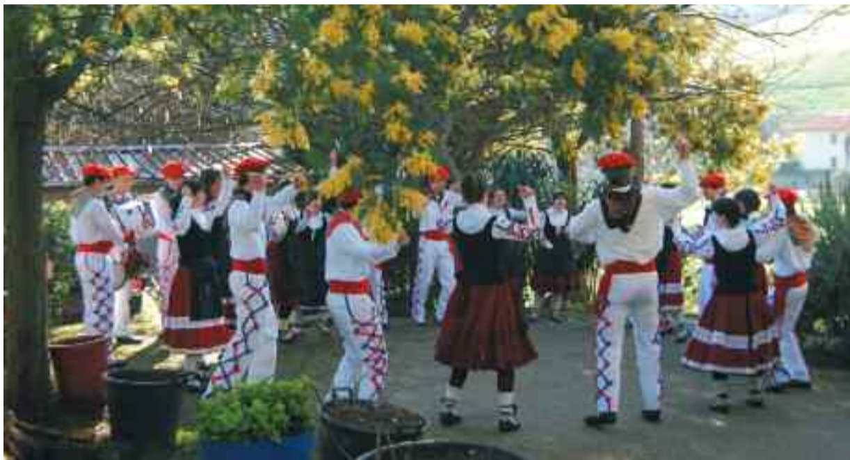
Goian, Adaxkaren Herri Inauteria, behean, Puska biltzea.