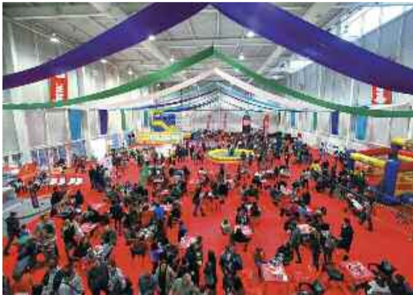
Eguberrietako Haur Parkeak 15.000 bisitari baino gehiago izan zituen.