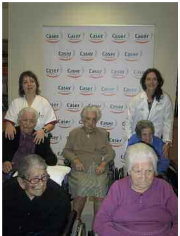
Bi urteko epean, beste bost egoiliar 100 urte izatera iritsiko dira.

Oraingoz, askoz gehiago dira emakumeak Caser Anakan, gizonak baino.