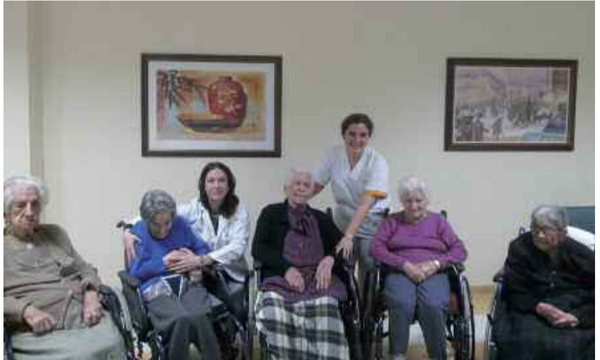
Caser Anakan 100 urte baino gehiago dituzten bost emakumeak omendu dituzte.

Ehun urtetik gorako egoiliarrei aipamen berezia egin nahi izan diete Caser Anakan, martxoaren 8ko ospakizunarekin lotuta. Bost dira guztira, denak emakumeak. “Gizarte hobea” eraikitzeko beharrezko balioen ordezkari direla azpimarratu du Elena de la Fuente zentroko gizarte langileak: “Lana, esfortzua eta ahalegina erakutsi dituzte, mende osan zehar zailtasunei aurre egiteko”.