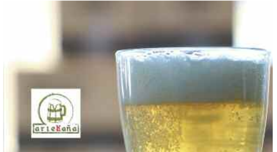
Artekaña izan da Ficoban antolatutako ekimen pribatu bat 2014ean.