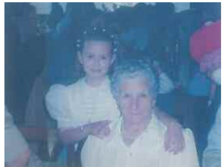
Reimundak 102 urte bete zituen martxoaren 15 ean