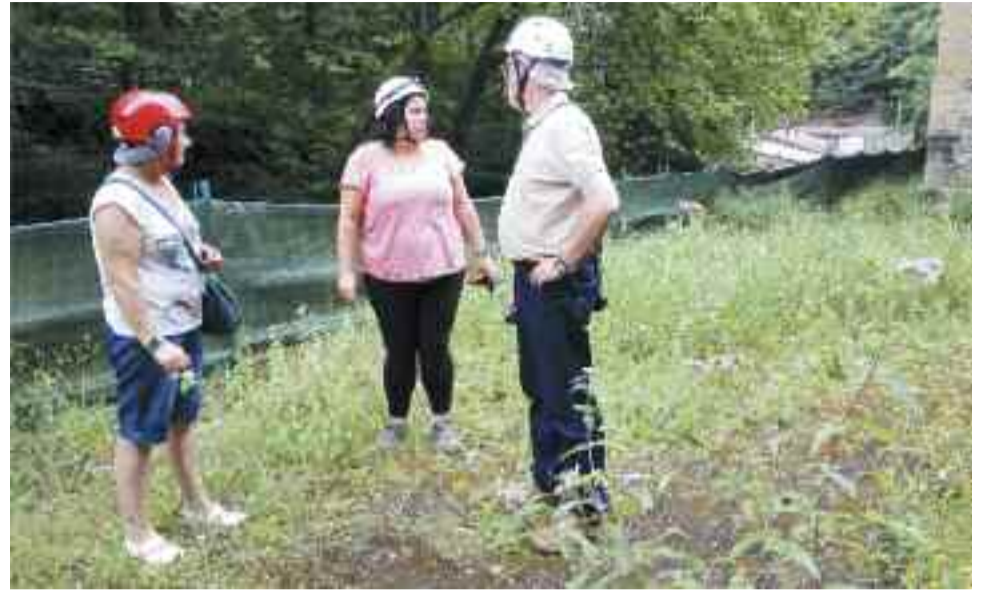
Meatzeei lotutako historia luzea du Irunek. Bisita gidatuen bidez ezagutu daiteke, gaur egun.

Burdin Aroan hasi ziren Aiako Harria zulatzen. Erromatarrek ere etekina atera zioten, eta Aro Modernotik aurrera, atzerriko konpainiek ustiatu zituzten Irungo meatzeak, Bigarren Mundu Gerraren garaian betiko abandonatu zituzten arte. 2008an, Irungo Udalak Irugurutzetako labeak eta meatzea bisitentzako atondu zituen, eta gaur egun, turista askok gehiago dakite Irungo meatzaritzari buruz, irundarrek beraiek baino.