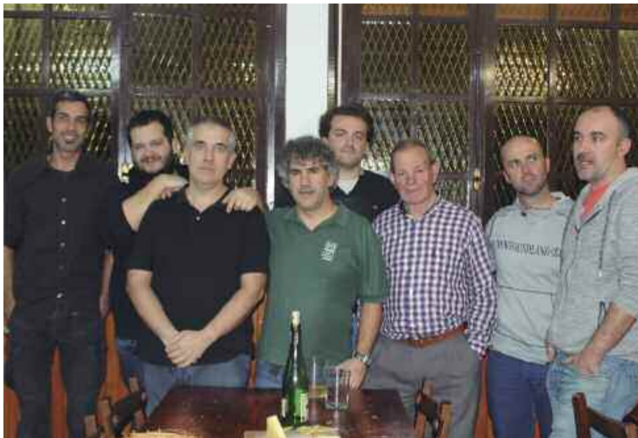
Jaizubiako Elkartean Ostegunetan biltzen diren bertso eskolako kideak

“Hasierako datuekin alderatuta, taldekide kopuruak gora egin du nabarmenki”