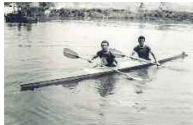
- G41340: Bidasoako I. jaitsiera Piraguan 1967. urtean.