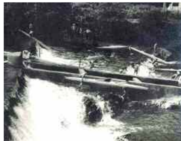
- G41401 Bidasoako I. Jaitsiera Piraguan 1967. urtean.

Santiagotarrak Kirol Elkarteak Bidasoa ibaiaren III. Herri Jaitsiera antolatu du Bidasoaren Nazioarteko LIII. Jaitsierarekin batera uztailaren 13rako. Iazko arrakasta ikusita, klubak aurtien ere proba errepikatzea erabaki du.