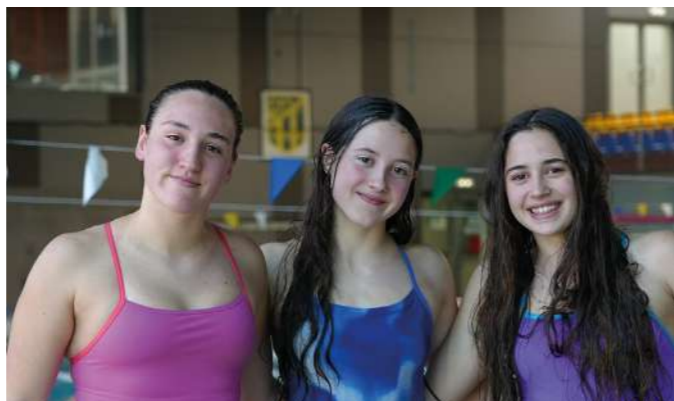
KIROLA: BIDASOA XXI 26