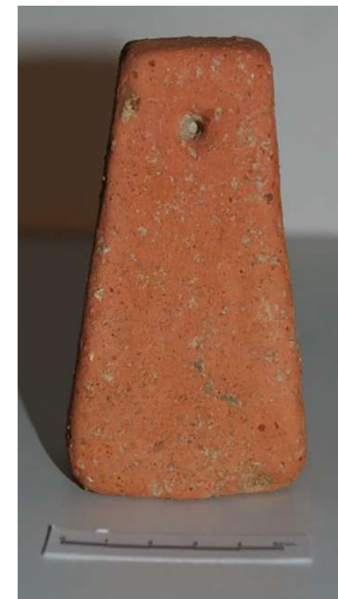
“Pondus”, ehuntzeko pixua. Oiasso Museoa.

Baina jatorrizko kolorea berreskuratzen zuten Fullonika tailer hauek, negozio oparoak bihurtu ziren. Horregatik Vespasiano enperadoreak, zerga bat ezarri zien pixa jasotzeagatik. Suetonio erromatar historialariak dioenez, Vespasianoren seme Tito ez zegoen neurri horrekin ados, eta aitari aurre egin zion. Orduan, Vespasiano enperadoreak urrezko txanpon bat sudurrera hurbildu, eta usain txarra ote zuen galdetu zion. Titok ezetz erantzun zionean, aitak horrela erantzun zion: “Atqui ex lotio est”, hau da, “Pixa da jatorria”. Hortik dator Vespasianoren Axioma ezaguna: Pecunia non olet, alegia, diruak ez du usainik!