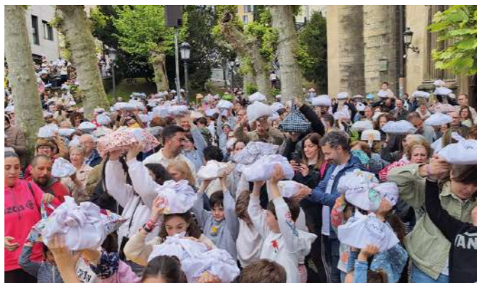
ARGAZKI-ERREPORTAJEA: OPILA EGUNA 8