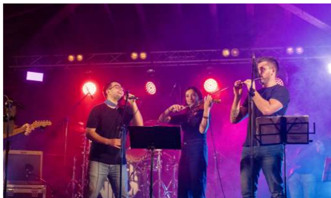
ELKARRIZKETA: FOLKESÍ 12