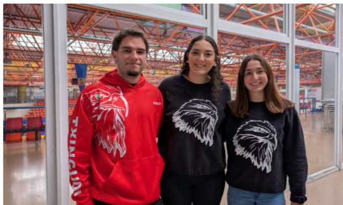
KIROLAK: TXINGUDI ESKUBALOIA 24